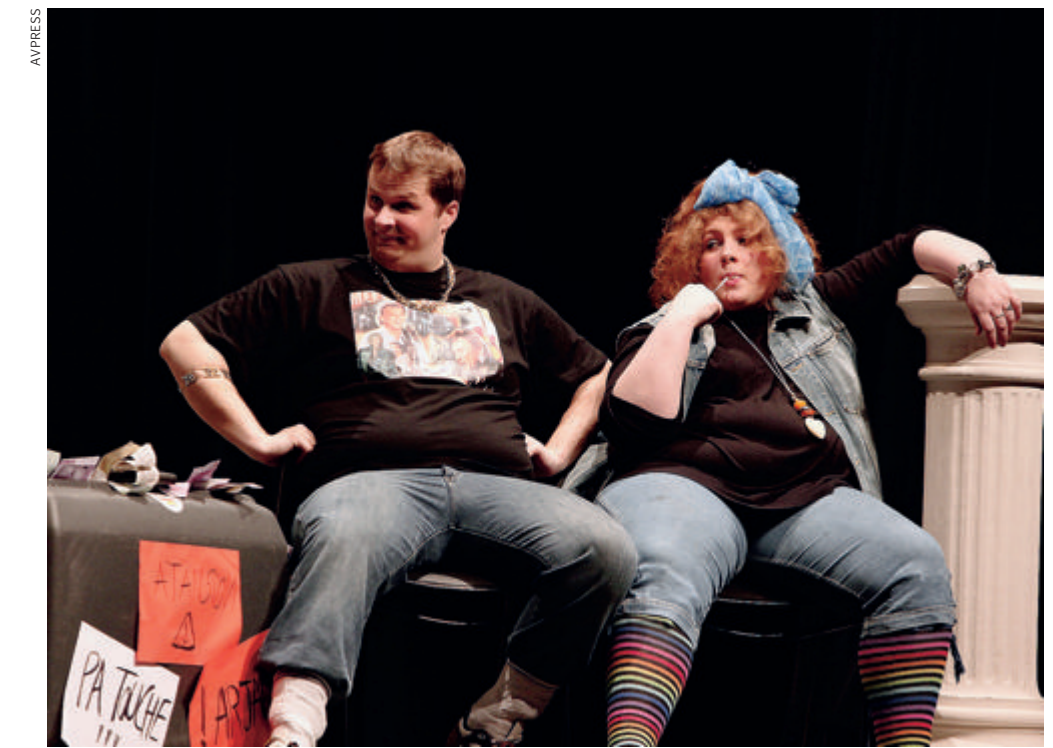
La création des Têtes de l'art, Pauvres riches , avait remporté un franc et hilarant succès l'an dernier!

SEULEMENT , le vol ne se passe pas du tout comme prévu. L'avion se crashe, et nos vacanciers plus atypiques les uns que les autres se retrouvent tous bloqués sur une île déserte. Une